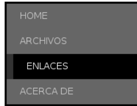
Figura 16.1: Menú vertical